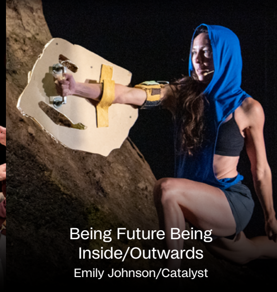
Being Future Being Inside/Outwards